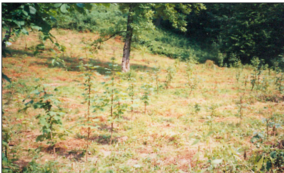
Slika 2: Odjel 123a, Gorski javor u razvojnoj fazi mladika, 2000. godina

Izbor vrsta drveća od kojih će biti sastavljena buduća sastojina neobično je važno pitanje u procesu pošumljavanja. Izbor vrsta drveća je prvi korak u ostvarivanju postavljenog cilja i ovo je primjer gdje je na ŠGP "KONJUH" Kladanj prekinuta tradicija očetinjavanja po svaku cijenu. Na lokalitetu Ravne njive blagovremeno i stručno su provođene mjere njege ( slika 2 i 3 ).