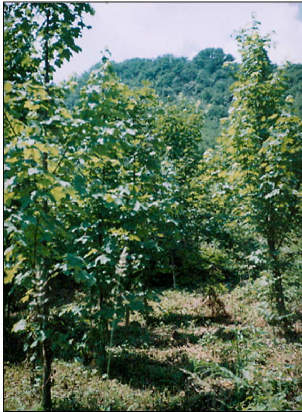
Slika 3: Odjel 123a, Gorski javor u razvojnoj fazi guštika, 2004. godina

Postoje brojni primjeri pozitivne obnove šuma sadnjom sadnica. Svakako, jedan o tih je uspješna realizacija gore navedenog projekta. Naime, danas je to kvalitetna sastojina u fazi jednoobraznog debljeg letvenjaka i tanjeg debeljaka ( slika 4 ).