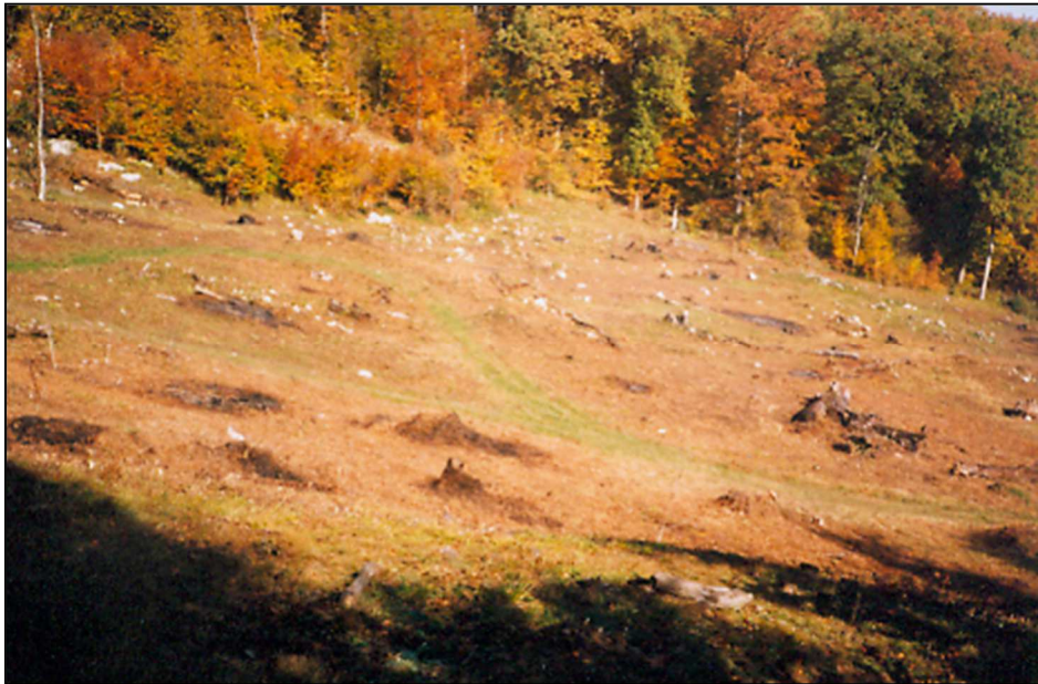
Slika 2: Odjel 123a, Priprema zemljišta za pošumljavanje, 1998. godina

U skladu s izvedbenim projektom "Rekultivacija šuma u vodozaštitnim zonama ŠGP „Konjuh“, a kojeg je finansirala Italijanska nevladina organizacija Nuova Frontiera u periodu 1998. do 2000. godine, uspješno je izvršena rekultivacija neplanski posječene površine u odjelima 123a i 124a, GJ "Gostelja", ŠGP "Konjuh" Kladanj ( nastala tokom rata ). Prije nego što se pristupilo sadnji, bilo je potrebno izvršiti pripremu zemljišta za pošumljavanje. Mehničkim putem uklonjene su nepoželjne vrste drveća ( breza, jasika ), izdanci, te obična bujad, malina i kupina ( slika 1 ).